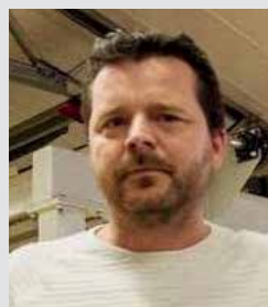
Ledamot, vice ordf.